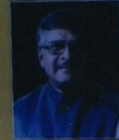
Shri Ravi Shankar Prasad Hon'ble Minister of Law & Justice, Electronics & IT, Government of India