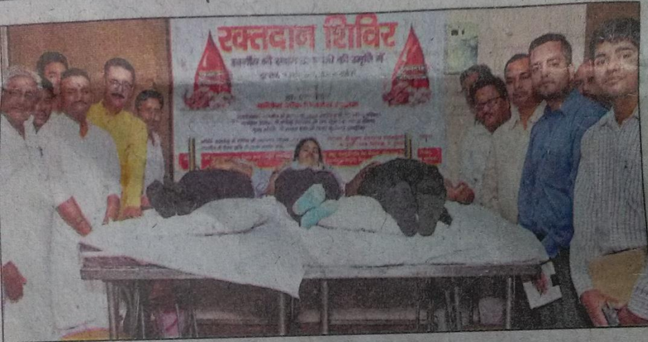
एमपीएस ग्रुप ऑफ इंस्टीट्यूशंस में रक्तदान करते छात्र-छात्राएं। • हिन्दुस्तान