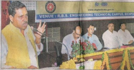
मंगलवार को बिचपुरी स्थित आरबीएस इंस्टीट्यूट में डिजिटल इंडिया पर आयोजित सेमिनार को संबोधित करते पूर्व केंद्रीय मंत्री रामशंकर कटेरिया और डिजिटल इंडिया पर आचारित नाटिका प्रस्तुत करते युवा।

लाइन से हटाकर लोगों को ऑनलाइन करने के लिए देश का युवा डिजिटल इंडिया का ब्रांड एम्बेसडर बनेगा। देश के 35 लाख युवा डिजिटल इंडिया के संवाहक बनेंगे। शहर से लेकर ग्रामीण क्षेत्र के अतिम व्यक्ति को डिजिटल दुनिया से जोड़ा जाएगा। ताकि उसे सरकार को योजनाएं और उसका अधिकार मिल सके। मिनिस्ट्री ऑफ इलेक्ट्रॉनिक्स एंड इंफोर्मेशन टेक्नोलॉजी ने मंगलवार को आरबीएस टेक्निकल कैम्पस में डिजिटल इंडिया के ब्रांड एम्बेसडर तैयार किए गए।