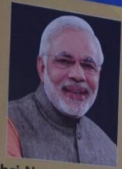
Shri Narendra Modi Prime Minister of India