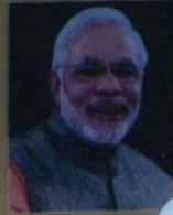
Shri Narendra Modi Prime Minister of India